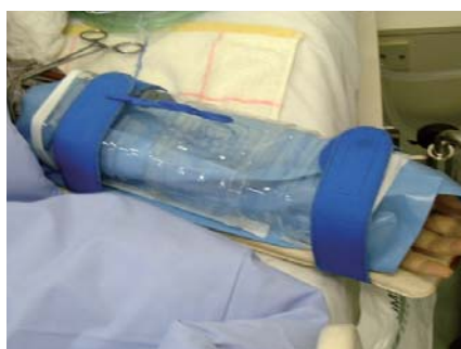
ペットボトル④ ペットボトルを半分にし、穿刺部カバーとして使用している。