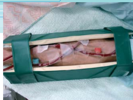
シーネ② シーネで保護をしている。