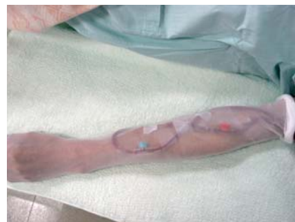
ストッキングで保護