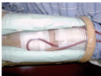
ペットボトル③ ペットボトルで、カニューレと回路を保護しているが、穿刺部位が本人から見えないうに紙シートで隠してある。