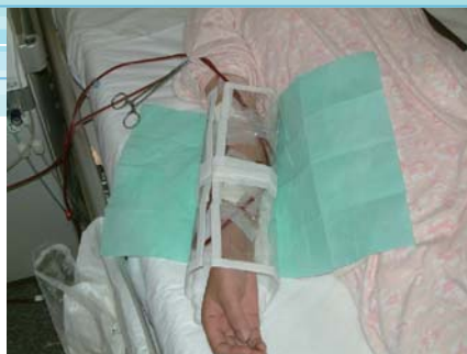
ペットボトル① ペットボトルを2個分繋ぎ、カニューレと回路を保護している。