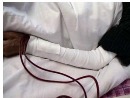
包帯② 腕全体を包帯で保護している。