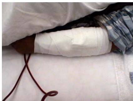
包帯① 針にテープを1回巻きつけてからクロス状に固定し、そのテープの上を太いテープにて固定し包帯固定する。