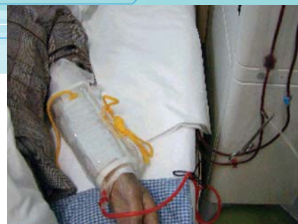
ペットボトル② ペットボトルで、カニューレと回路を保護しているが、疑似回路を持たせ、本来の回路はシートの下に隠してある。