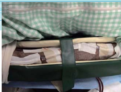
シーネ① エラストポアで針および回路をすべて固定し、シーネ固定を行う。