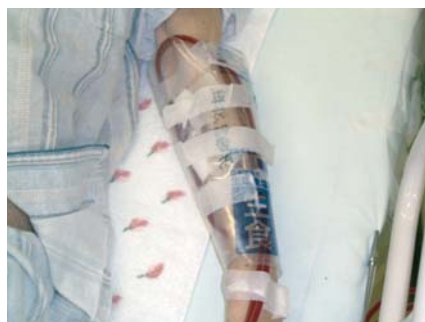
生食バッグ 使用後の生食バッグを解体し、巻きつけて保護している。